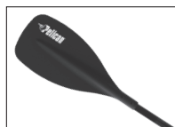
MAELSTRÖM PADDLE PAGAIE MAELSTRÖM