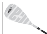
VATE PADDLE PAGAIE VATE