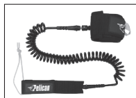
SUP LEASH LAISSE SUP