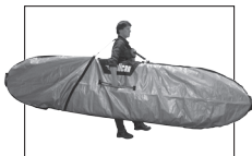
SUP BOARD BAG SAC DE TRANSPORT POUR SUP