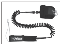
SUP LEASH LAISSE SUP