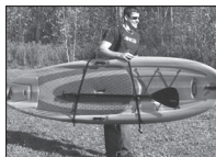
CARRIER STRAP COURROIE DE TRANSPORT