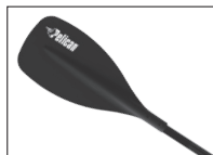
MAELSTRÖM PADDLE PAGAIE MAELSTRÖM