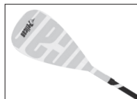
VATE PADDLE PAGAIE VATE